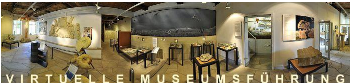
Das Museum von innen